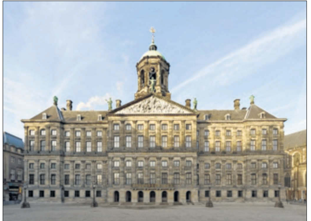
Koninklijk Paleis Amsterdam

Niet alleen in het gebouw heeft koning Lodewijk Napoleon zijn sporen nagelaten. Met zijn beleid bouwde Lodewijk in de vier jaren van zijn koningschap voort op hervormingen die tussen 1795 en 1806 tijdens de Bataafse Republiek waren ingezet. Hij bespoedigde en implementeerde belangrijke maatregelen die tot op de dag van vandaag voelbaar zijn. In 1810 werd Lodewijk Napoleon gedwongen afstand te doen van de troon en werd Holland ingelijfd bij Frankrijk. Na het vertrek van de Fransen heeft het gebouw thans ontvangstpaleis van het Koninklijk Huis - zijn paleisfunctie behouden. Willem I die in 1814 de troon besteeg heeft het door Lodewijk Napoleon geïntroduceerde moderne koningschap voortgezet evenals de latere Oranjes.