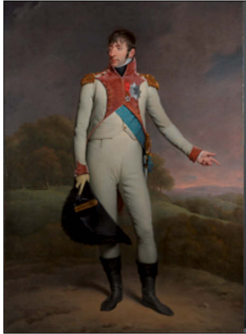
Lodewijk Napoleon, koning van Holland van 1808-1810 / Charles Howard Hodges (1764-1837), 1809

Vanaf 29 juni t/m 16 september is de tentoonstelling Koning Lodewijk Napoleon & zijn Paleis op de Dam te zien in het Koninklijk Paleis Amsterdam. In de tentoonstelling staat het gebouw als Frans Koninklijk Paleis centraal en wordt ingegaan op de bijzondere erfenis van het regeringsbeleid van Lodewijk Napoleon als eerste koning van Holland.